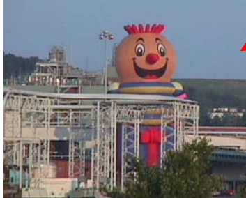
آوریل: شرایط اضطراری