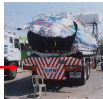
سپتامبر: پروانه کار گرم

حوادث در تمام نقاط دنیا اتفاق می افتند ولی آنچه مهم است بررسی، تجزیه و تحلیل و اطلاع رسانی آنست که میتواند راهگشایی برای جلوگیری از وقوع مجدد حوادث مشابه است. حوادث فوق حوادثی است که در مکانهای مختلف دنیا رخ داده امید است با مرور این حوادث و آگاهی از علل آن بتوانید از بروز حادثه مشابه در شرکت خود جلوگیری کنید.