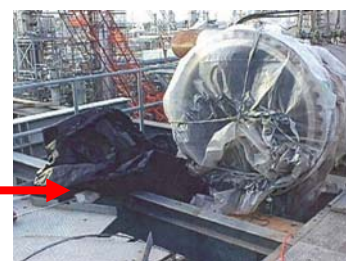
آگوست: فضاهای سربسته موقت