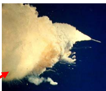
جون: فرهنگ ایمنی