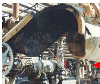
نوامبر: شکستگی ناش از برودت